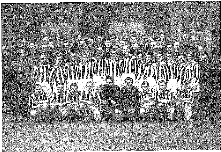
Platzelweihung am 17. März 1954 1. und 2. Mannschaft, Vorstand und Mitglieder