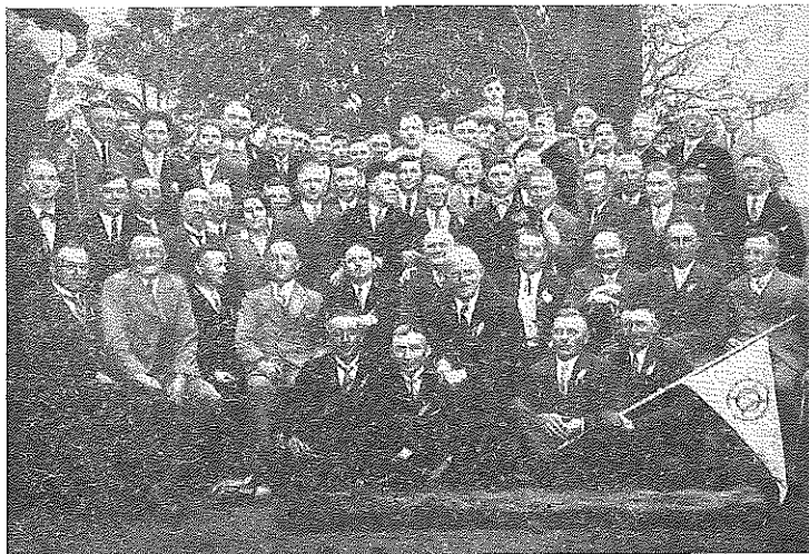
20 jähriges Stiftungsfest des Sportvereins „Hertha“ Otze am 25. Mai 1930

Das Jahr 1929 brachte keine Veränderungen im Vorstand. Vermerkt wurde nur die Anschaffung einer Abkreidemaschine.