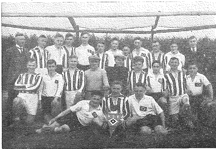
1. Mannschaft mit HSV

Im gleichen Jahre wurde die Spielgemeinschaft Otze-Hänigsen nach etwa fünfjähriger Dauer aufgelöst, nachdem von Hänigsen kaum noch Spieler zu den angesetzten Spielen erschienen. Auswärtigen Mitgliedern wurde ein Jahresbeitrag von 2,— Mark auferlegt, der heute nach 34 Jahren noch seine Gültigkeit hat.