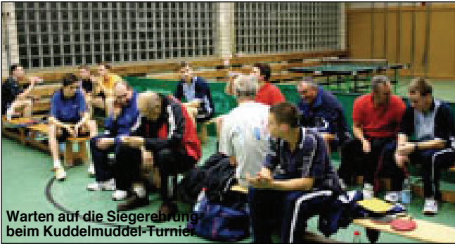
Warten auf die Siegerehrung beim Kuddelmuddel-Turnier

Die Punktspielrunde 2007/8 konnten wir mit 8 Mannschaften bestreiten. Diese Mannschaften bestanden aus 3 Herren und 5 (fünf!) Jugendmannschaften. Keine Ahnung ob das Vereinsrekord ist, aber wir sind mächtig stolz. Fangen wir mit unseren Jüngsten an. Die beiden Schüler B-Mannschaften belegen z. Zt. zwar nur den 6 +7 Platz, aber sie müssen erstens noch 3 Spiele bestreiten und zweitens befinden sie sich noch in der Lernphase. Aller Anfang ist schwer. Jeder weiß, das Training und Punktspielbetrieb zwei paar Schuhe sind. Also Jungs, lasst euch nicht beirren, ihr macht das hervorragend.