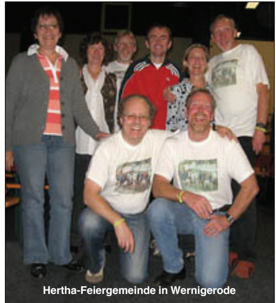
Hertha-Feiergemeinde in Wernigerode

nacht schon zu Ende war. Aber dadurch konnten die Feiernden noch den Hawaii-Triathlon im Fernsehen verfolgen.