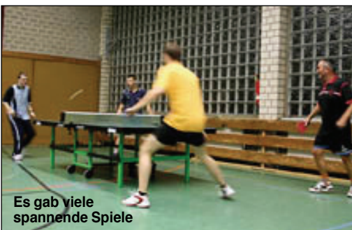
Es gab viele spannende Spiele

Aber was heißt das schon, es gibt doch noch eine Rückrunde und dann werden die Karten wieder neu gemischt.