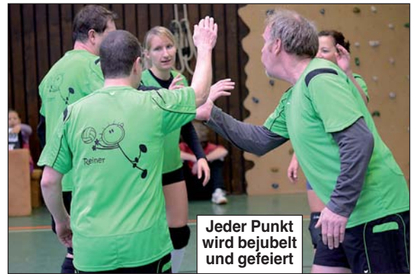
Jeder Punkt wird bejubelt und gefeiert

loren. Nach dem Seitenwechsel spielten wir auf der „schlechteren Seite“. Mit einer guten Mannschaftsleitung und einer Umstellung der Grundaufstellung konnten wir den Satz mit 25:22 für uns entscheiden.