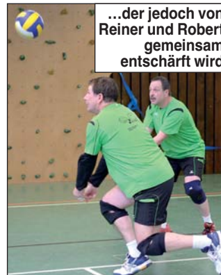
...der jedoch von Reiner und Robert gemeinsam entschärft wird