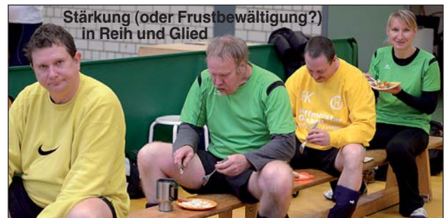
Stärkung (oder Frustbewältigung?) in Reih und Glied