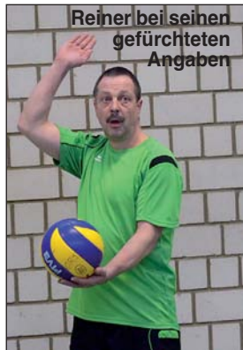
Reiner bei seinen gefürchteten Angäben