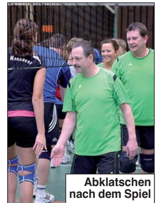
Abklatschen nach dem Spiel