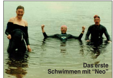
Das erste Schwimmen mit "Neo"

fuhren wir zum Freizeitgebiet rund um den Brombachsee bei Spalt. Das ist schon eine tolle Gegend.