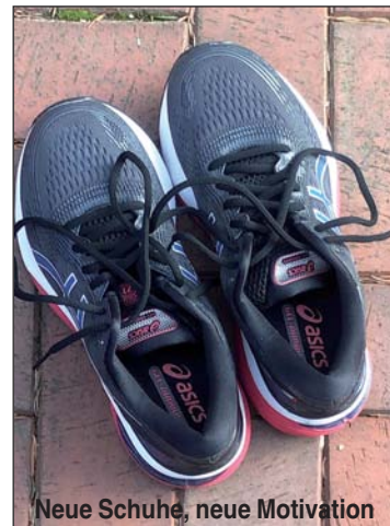
Neue Schuhe, neue Motivation