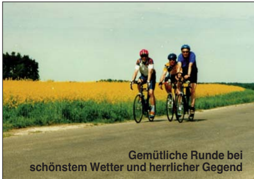
Gemütliche Runde bei schönstem Wetter und herrlicher Gegend

An diesem Tag fuhren wir natürlich auch noch eine „kleine Rad Runde“ von ca. 80 km. Dabei überraschte uns aber auch noch ein Gewitter. Zum Glück war da ein kleiner Ort (Rohr bei Freystadt) mit einer Dorfkneipe. Aber keine gewöhnliche Gastwirtschaft – nein, die Kneipe hieß (und heißt heute noch so laut Internet) ZAPPA. Diese Musikkneipe hatte viele Bilder von dem Kultmusiker Frank Zappa an den Wänden. Das bleibt auch nach 20 Jahren noch in Erinnerung. Gut, dass das Gewitter gerade zu diesem Zeitpunkt kam. Sonst hätten wir diese Kneipe nie gefunden. Auch diesen Abend verbrachten wir in gemütlicher Runde. Nach der Woche Trainingslager sollte auf der Rückfahrt noch etwas Ungewöhnliches passieren. Aber erst einmal mussten wir ja das Auto wieder mit allen Sachen und den vier Rennrädern beladen. Auf dem Weg von Roth nach Hause liegt auch noch die Zentrale von ADIDAS mit Werksverkauf. In die mussten wir auch noch reinschauen. Ein paar Kleinigkeiten kauften wir auch noch.