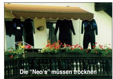
Die "Neo's" müssen trocknen

Die Neopren-Anzüge mussten ja auch noch immer trocknen. Zum Glück hatte unsere Unterkunft einen großen Balkon. Dort hingen dann vier "toten Männer", wie wir sie getauft hatten.