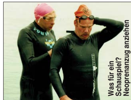
Was für ein Schauspiel? Neoprenanzug anziehen

Natürlich machten wir gemeinsame Laufeinheiten direkt am Main-Donau-Kanal auf der Wettkampfstrecke. Nach kurzer Pause ging es wieder auf das Rennrad, um auch mal die Gegend kennenzulernen. Bei bestem Wetter