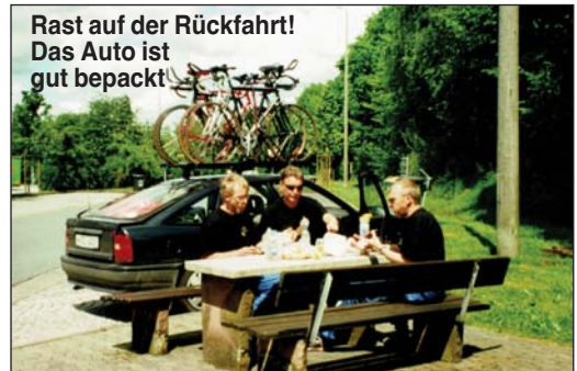
Rast auf der Rückfahrt! Das Auto ist gut bepackt!