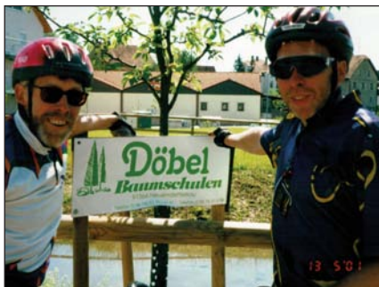
Das musste festgehalten werden. Zwei Döbels vor der Baumschule Döbel

An diesem Tag fuhren wir natürlich auch noch eine „kleine Rad Runde“ von ca. 80 km. Dabei überraschte uns aber auch noch ein Gewitter. Zum Glück war da ein kleiner Ort (Rohr bei Freystadt) mit einer Dorfkneipe. Aber keine gewöhnliche Gastwirtschaft – nein, die Kneipe hieß (und heißt heute noch so laut Internet) ZAPPA. Diese Musikkneipe hatte viele Bilder von dem Kultmusiker Frank Zappa an den Wänden. Das bleibt auch nach 20 Jahren noch in Erinnerung. Gut, dass das Gewitter gerade zu diesem Zeitpunkt kam. Sonst hätten wir diese Kneipe nie gefunden. Auch diesen Abend verbrachten wir in gemütlicher Runde. Nach der Woche Trainingslager sollte auf der Rückfahrt noch etwas Ungewöhnliches passieren. Aber erst einmal mussten wir ja das Auto wieder mit allen Sachen und den vier Rennrädern beladen. Auf dem Weg von Roth nach Hause liegt auch noch die Zentrale von ADIDAS mit Werksverkauf. In die mussten wir auch noch reinschauen. Ein paar Kleinigkeiten kauften wir auch noch.