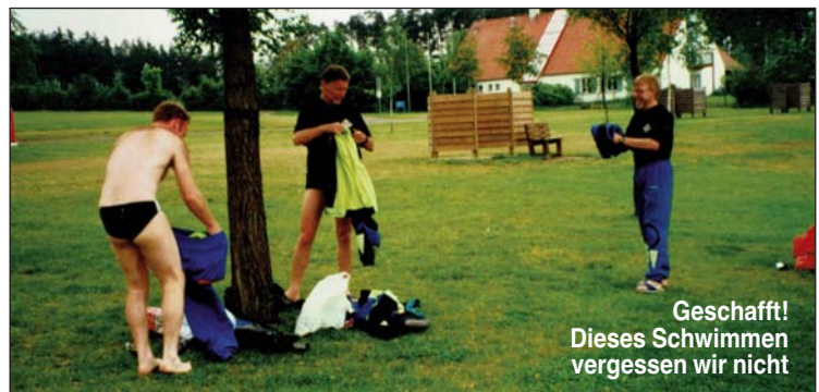
Geschafft! Dieses Schwimmen vergessen wir nicht