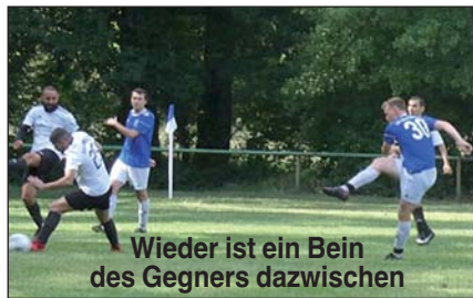
Wieder ist ein Bein des Gegners dazwischen