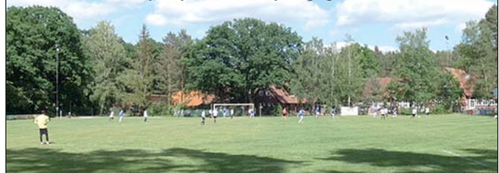
Der Otzer Waldsportplatz beim Spiel gegen Altwarmbüchen

Dies hatte zur Folge, dass die Heimmannschaft sich noch einige Chancen erspielte. Zu unserem Glück kamen dabei nur wenige Schüsse auf unser Tor, weshalb Basti nur selten eingreifen musste. Zehn Minuten vor Ende musste er jedoch den Ball aus dem Tor fischen, da er einen eigentlich sehr ungefährlich wirkenden Torschuss nicht abwehren konnte.