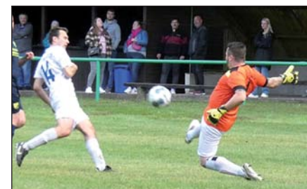
Diese 4 Fotos sind vom letzten Spiel gegen Friesen Hänigsen