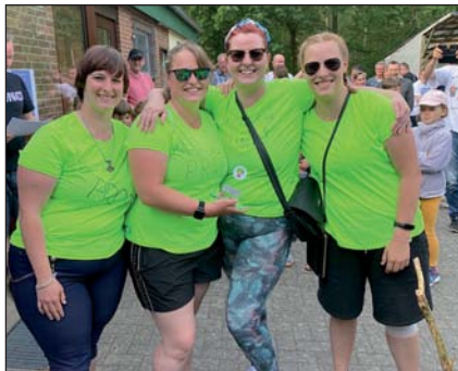
Team Ahuuu – Sieger Damen