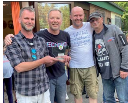
Team Peters Stammtisch – Sieger Herren

Wiederholung im nächsten Jahr schon fest eingeplant