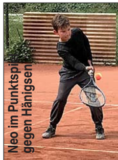
Neo im Punktspiel gegen Hänigsen

Die Tennissaison 2022 begann Ende April beim SV Hertha Otze. Nachdem die Platzaufbereitung fertig gestellt war, konnten wir es alle kaum erwarten, die ersten Bälle im Freien zu schlagen. Es kehrte aber schnell