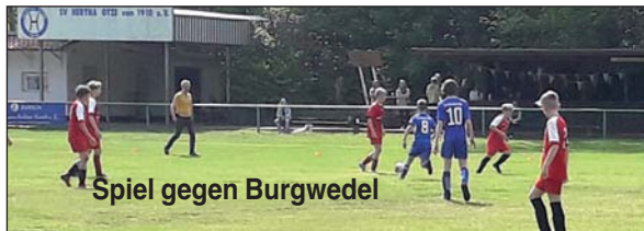
Spiel gegen Burgwedel