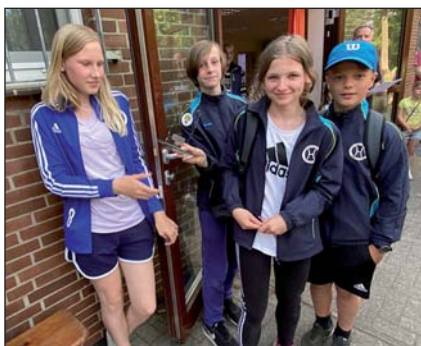
Team Baum – Sieger Kinder