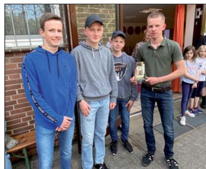
Team die Otzer – Sieger Jugend