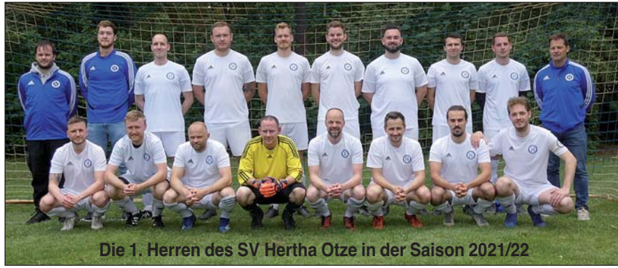
Die 1. Herren des SV Hertha Otze in der Saison 2021/22