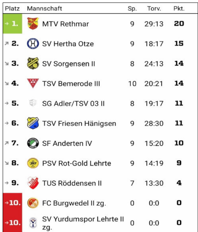
Tabelle Stand 21.3.26

Gasthaus & Hotel Bähre Familienbetrieb seit 1898