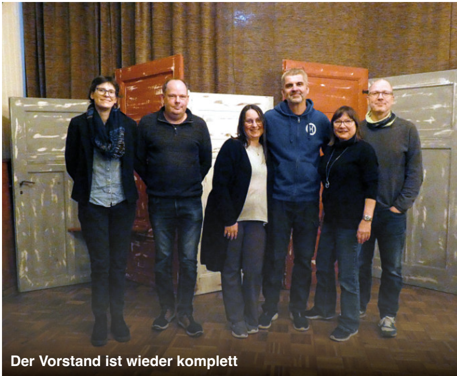
Der Vorstand ist wieder komplett

37. Jahrgang Mit Berichten aus dem Verein und dem Otzer Dorfgeschehen