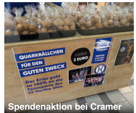
Spendenaktion bei Cramer