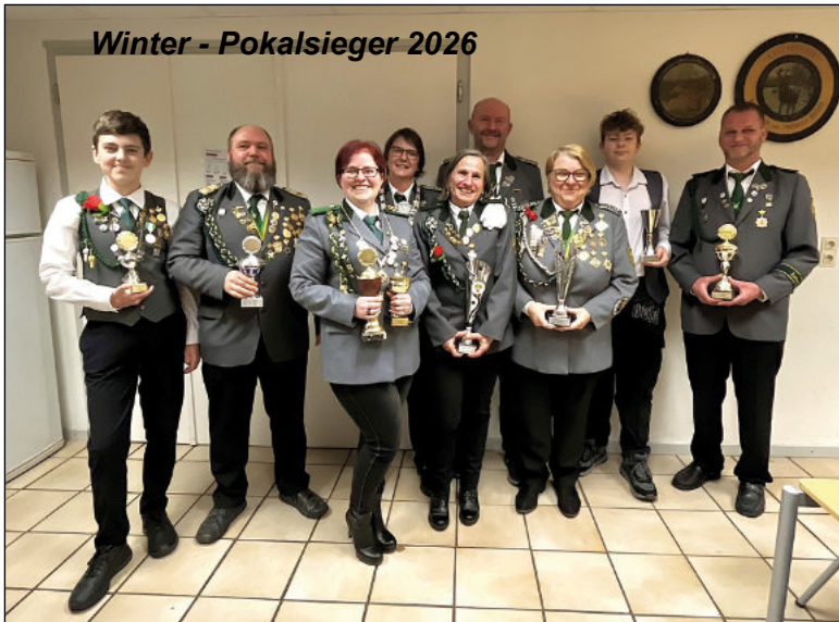
Winter - Pokalsieger 2026