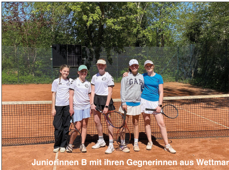
Juniorinnen B mit ihren Gegnerinnen aus Wettmar

court zu Junioren C) mussten die Jungen das erste Mal in einem Punktspiel auf dem „großen“ Tennisfeld spielen. Trotz viel Gegenwehr mussten sich die Junioren C am Ende 0-3 geschlagen geben.