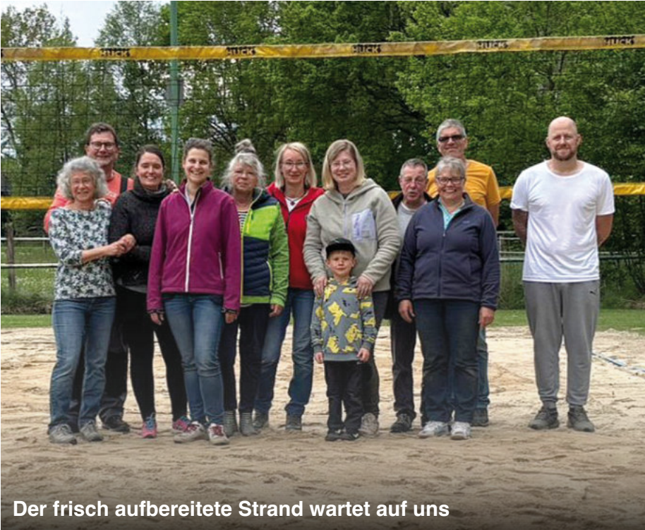
Der frisch aufbereitete Strand wartet auf uns

37. Jahrgang Mit Berichten aus dem Verein und dem Otzer Dorfgeschehen